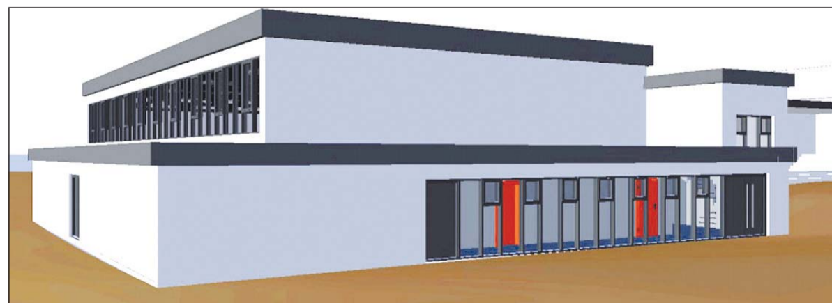
Der Entwurf der neuen Turnhalle vom Architekturbüro Czesla & Kollegen. Die Sporthalle soll besonders energiesparend sein und steht deshalb ganz oben auf der Dringlichkeitsliste.

Baubeginn soll laut Aussage des Beigeordneten in den kommenden Sommerferien sein. Nach der Planung soll die Turnhalle dann pünktlich zum Schuljahr 2011 fertiggestellt sein.